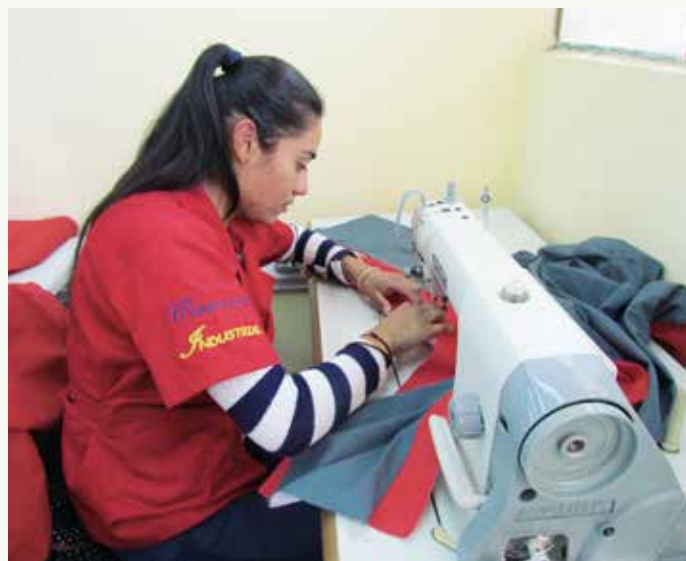
Fotografías: Formación técnica Bolivia, CEA Francisco Cermeño.